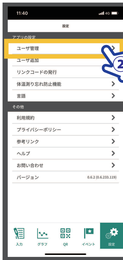
②【ユーザ管理】をタップ