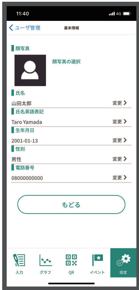
④ 6項目の基本情報を入力します。